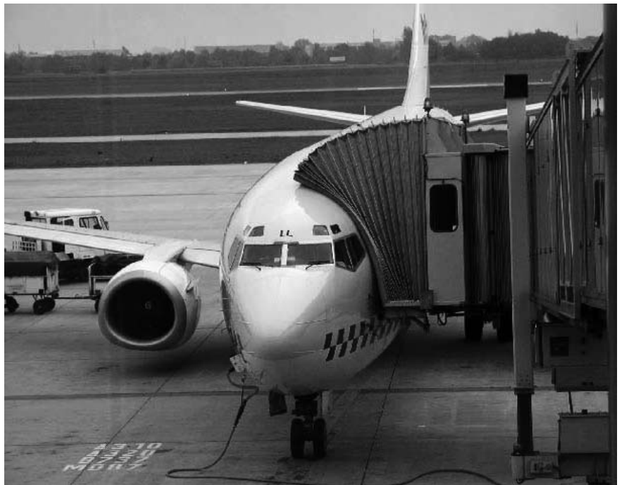
Durch den Bau des Münchener Flughafens wurden die Bodenbesitzer um 15 Milliarden Euro reicher – zulasten der übrigen Bevölkerung.

Welche konkreten Nachteile für die Allgemeinheit mit der Privatisierung des Bodens verbunden sein können, zeigt das Beispiel der Stadt Zü-