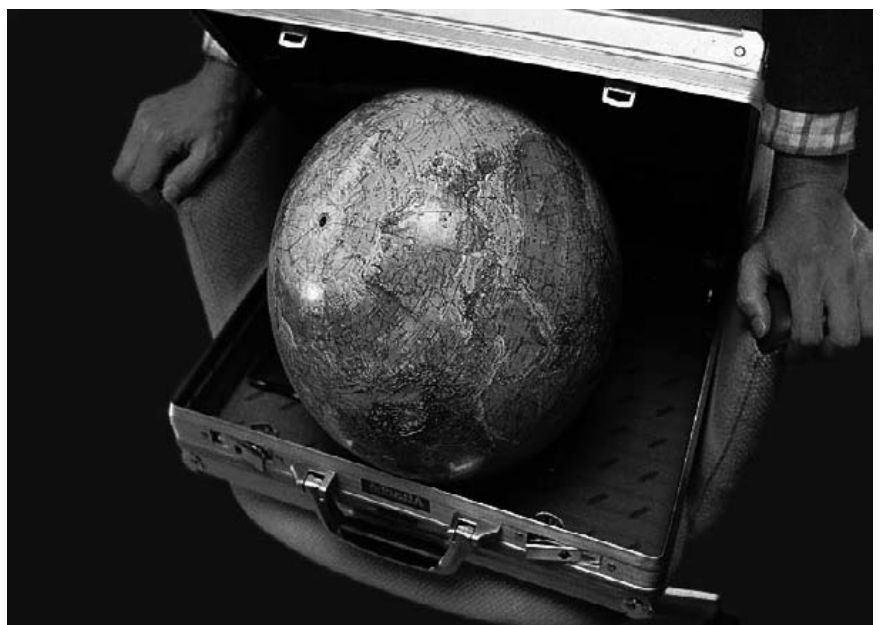
Die weltweiten Handelsbeziehungen führen nach und nach zu grenzüberschreitenden Angleichungen der Arbeitseinkommen. Diese sind für uns mit Abstrichen zu Gunsten ärmerer Länder verbunden.

Vollbeschäftigung ist in jeder Gemeinschaft zu jeder Zeit zu verwirklichen und damit Arbeitslosigkeit zu vermeiden, wenn die vorhandene Arbeit und der damit verknüpfte Lohn auf alle Arbeitswilligen flexibel verteilt wird. Flexibel