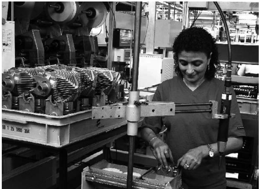
Arbeitszeitverkürzung statt Arbeitszeitverlängerung: Bei VW und Opel haben die verkürzten Arbeitszeiten zu einer zusätzlichen Wochenschicht und damit zu mehr Einstellungen geführt.

Als weiteres Patentrezept zur Überwindung der Arbeitslosigkeit wird