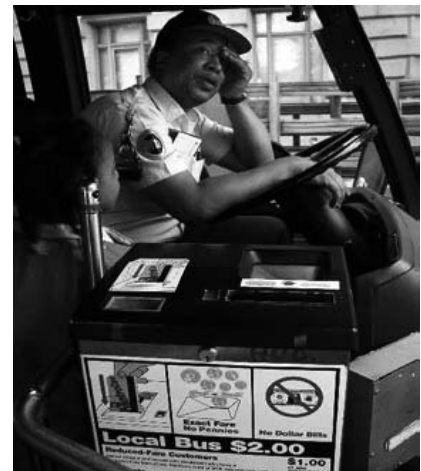
Die Opfer der globalen Ausweitung des kapitalistischen Systems sind die Arbeitleistenden.

Die Frage, Arbeitszeiten verlängern oder verkürzen, ist letztlich ein Streit um des Kaisers Bart, und der Versuch, mit längerer Arbeit mehr Arbeit zu schaffen, ähnlich illusorisch wie der, sich an den eigenen Haaren aus dem Sumpf zu ziehen. Entweder verteilen wir die Arbeit und den damit verbundenen Lohn mit Hilfe verkürzter Arbeitszeiten auf alle Arbeitswilligen, oder wir halten die Arbeitszeiten und Löhne für die Beschäftigten auf der bisherigen Höhe, bei weiter zunehmenden