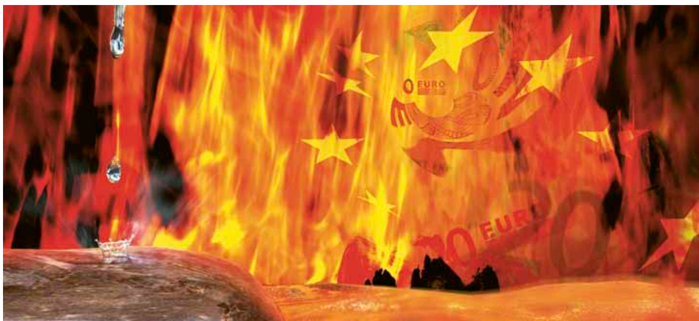
Illustration: Martin Bangemann

Die Nichtregierungsorganisation „attac“ kann sich freuen. Ursprünglich gegründet um eine sogenannte „Tobin Tax“ einzuführen, ist sie ihrem Ziel sehr nahe. Die EU will den auch von der deutschen Regierung geäußerten Willen für eine Finanztransaktionssteuer in die politische Tat umsetzen 1 . Die Einstellung der Regierungskoalition von CDU/CSU und FDP in dieser Frage scheint sich um 180 Grad gedreht zu haben, denn noch wenige Tage zuvor gab es eine entschlossene Ablehnung. Der politische Druck des „Faktischen“ zu Aktionen gegen den Finanzmarkt muss immens sein. Das am meisten gehörte Argument gegen die Finanztransaktionssteuer lautete stets, dass eine internationale Einführung nötig sei, um Kapitalflucht in Länder ohne diese Steuer zu verhindern. Ein Argument, das nun vom Tisch zu sein scheint, denn noch machen die USA und die G20 keine Anstalten, es den Europäern gleich zu tun.